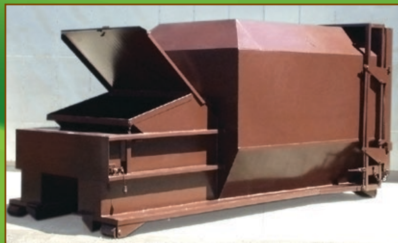
Couvercle contrebalancé arrière