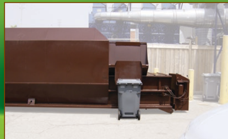
Trémie fermée avec déverseur de bac