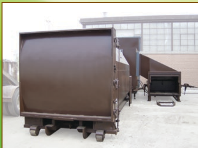
Structure fermée résistante aux intempéries avec chute latérale