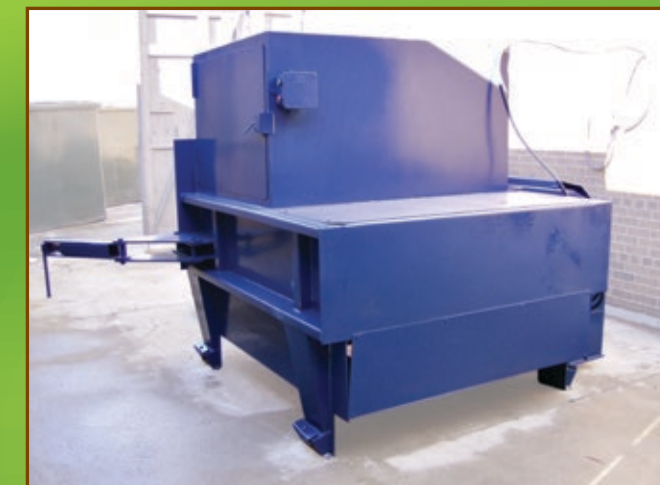
Trémie avec porte à charnière