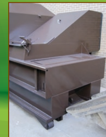
Chute à manivelle rétractable