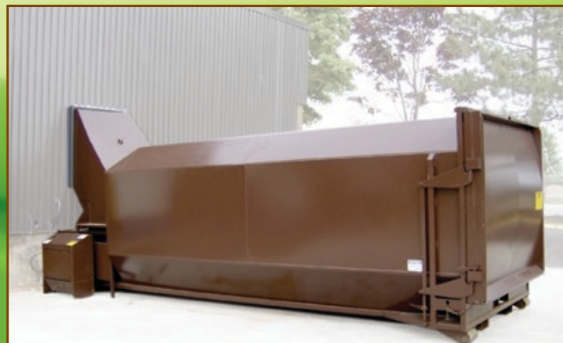
Chute de façade arrière